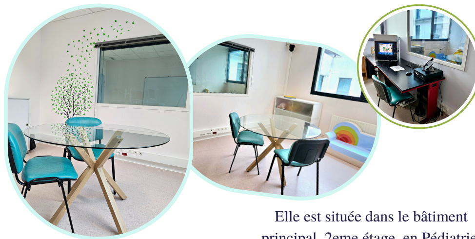
Elle est située dans le bâtiment principal, 2eme étage, en Pédiatrie.